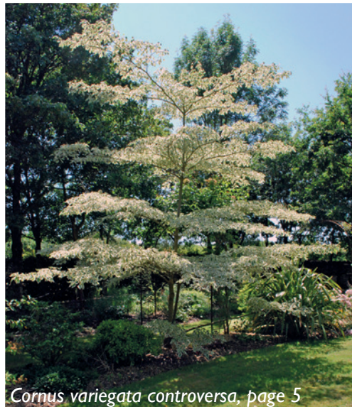
Cornus variegata controversa , page 5