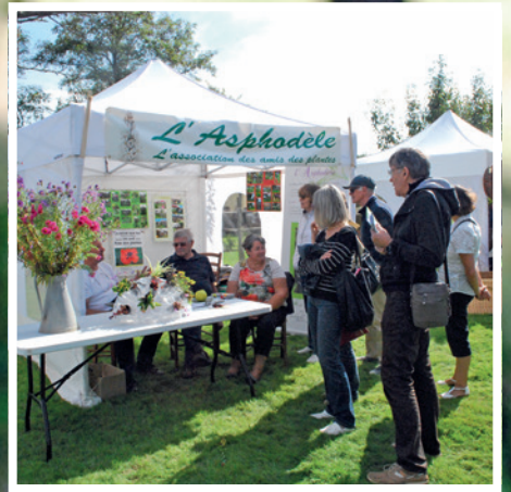
Automne 2015 en Pays Mareuillais