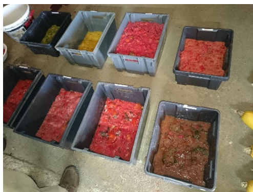
Là, les tomates libèrent leurs graines