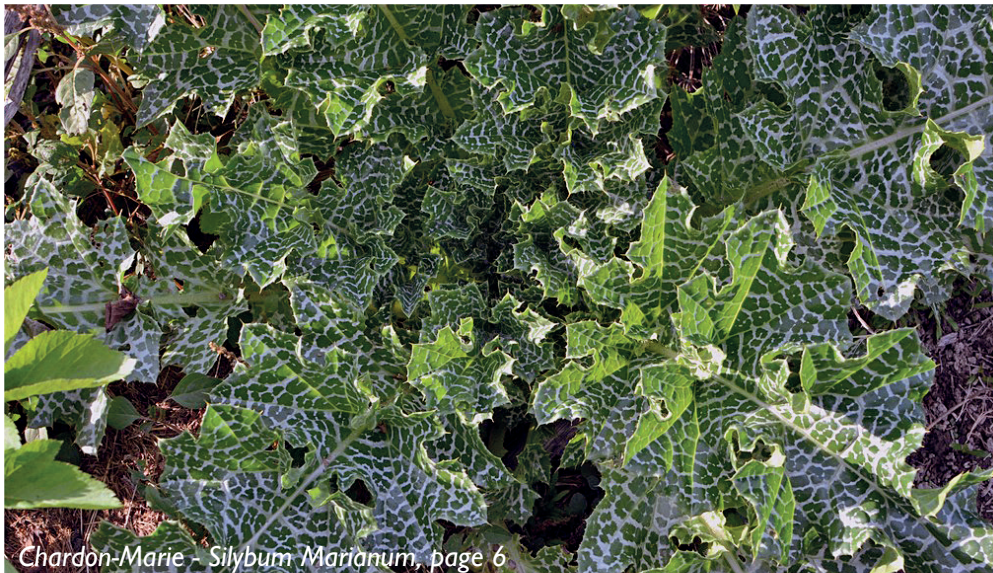
Chardon-Marie - Silybum Marianum , page 6